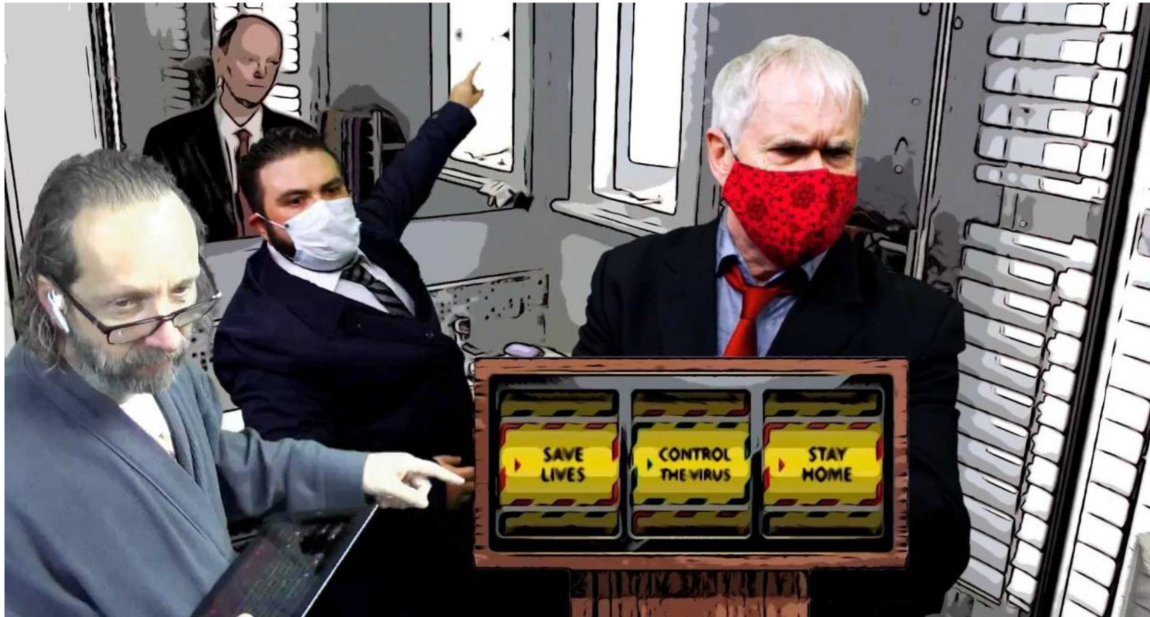
> Telematic Quarantine (2020)