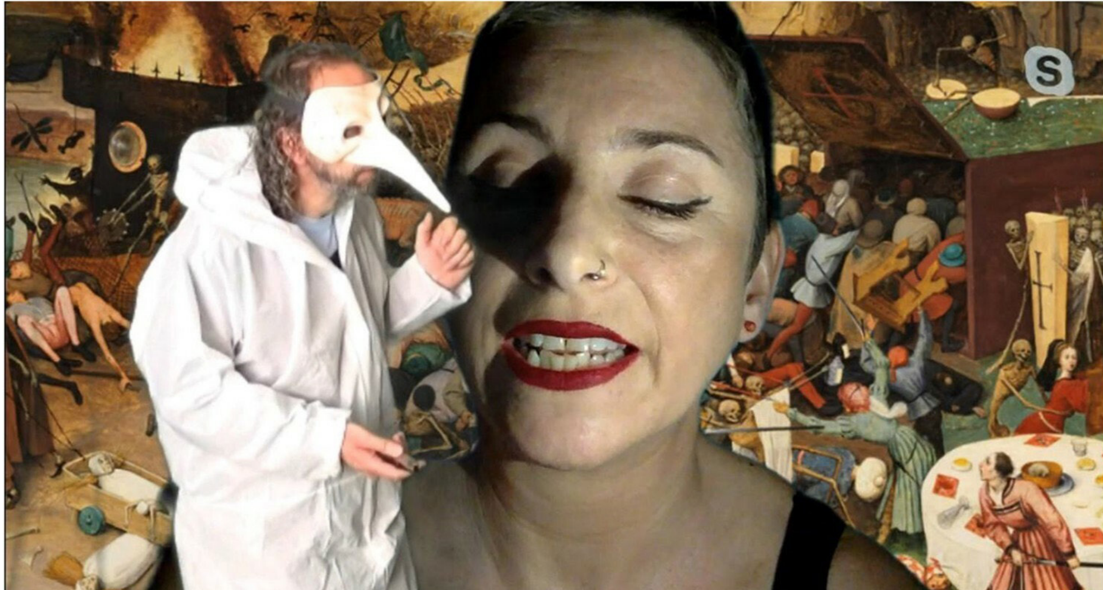
> Pandemic Encounters (2020)