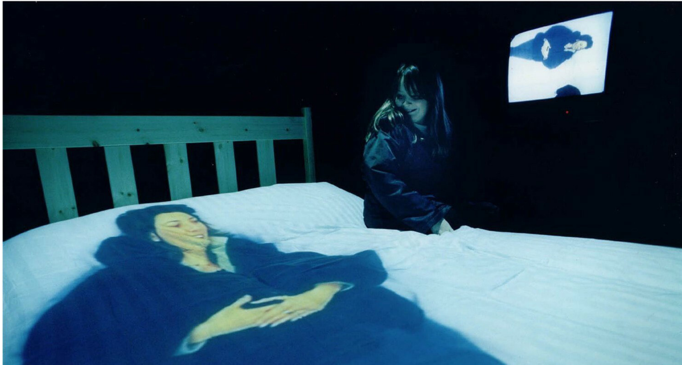
> Telematic Dreaming (1992) - Paul Sermon.