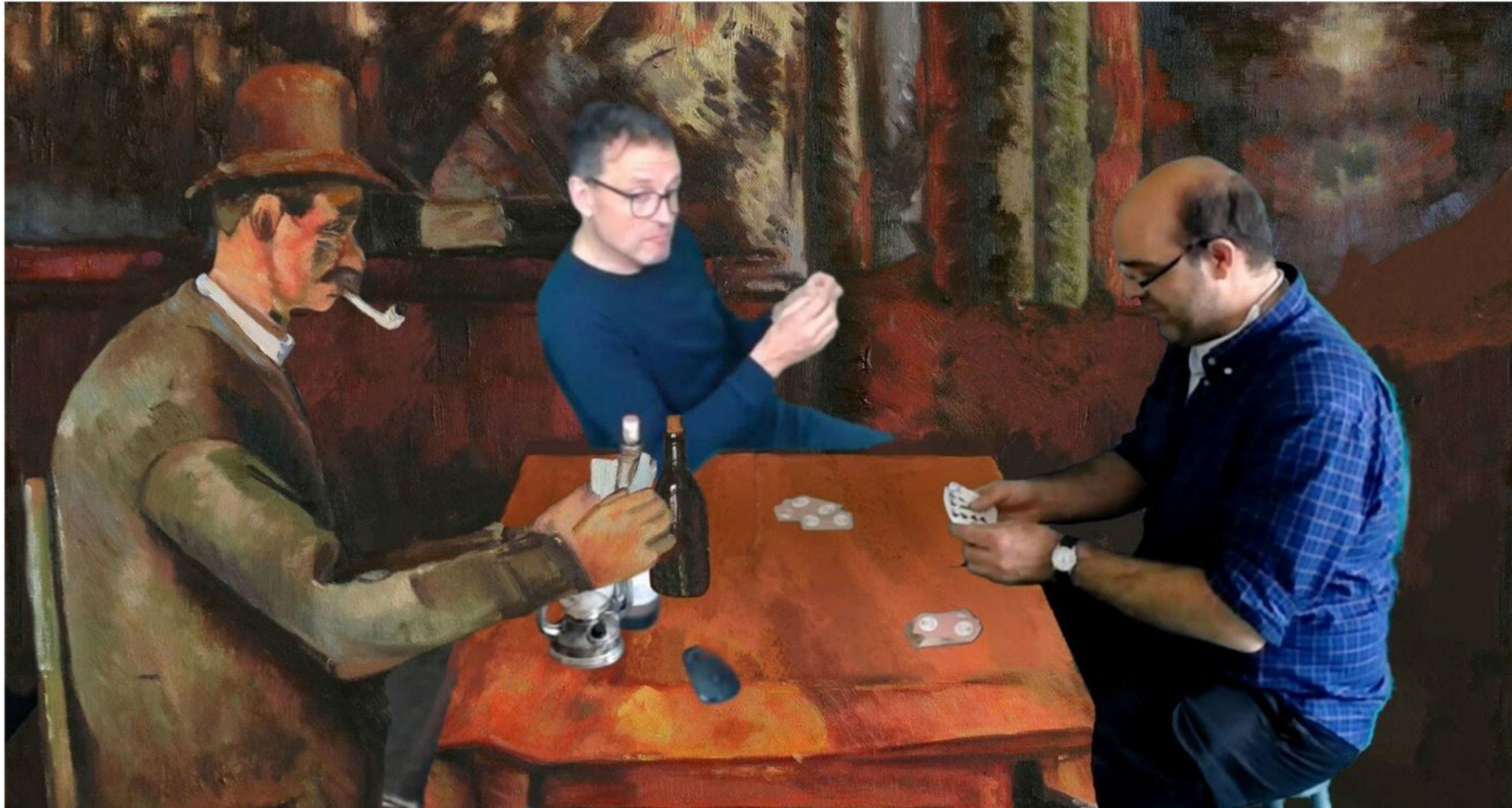
> Creation Theatre - Reprise de Les joueurs de cartes de Paul Cézanne (1895).